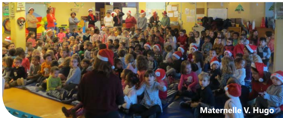
Maternelle V. Hugo

Du côté des scolaires, ce sont deux spectacles, offerts par la municipalité, La fée amoureuse pour les maternelles et Un fantôme adoré pour les plus grands, qui ont plongé les enfants dans la féerie des fêtes de fin d'année.