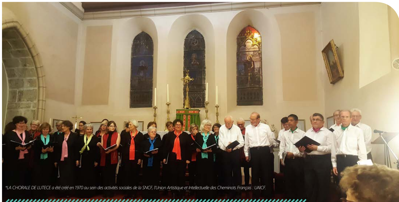
*LA CHORALE DE LUTECE a été créé en 1970 au sein des activités sociales de la SNCF, l'Union Artistique et Intellectuelle des Cheminots Français : UAICF.