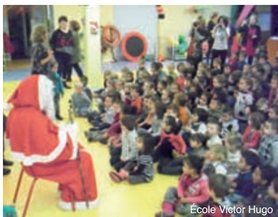
École Victor Hugo