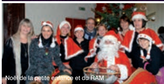
Noël de la petite enfance et du RAM