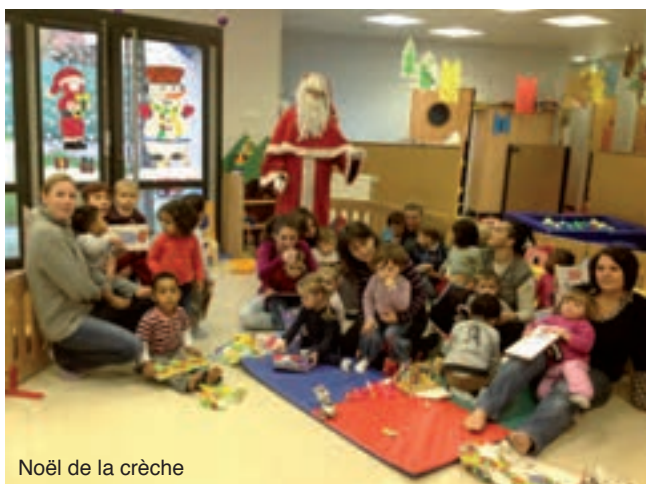
Noël de la crèche