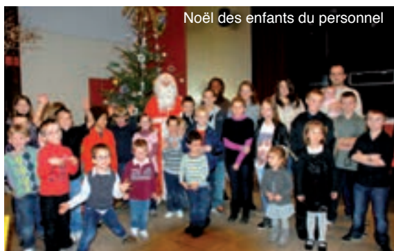
Noël des enfants du personnel