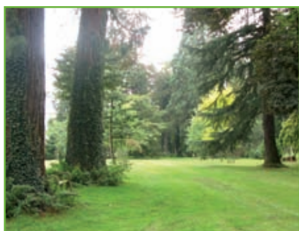
Cadre de vie : 15 €