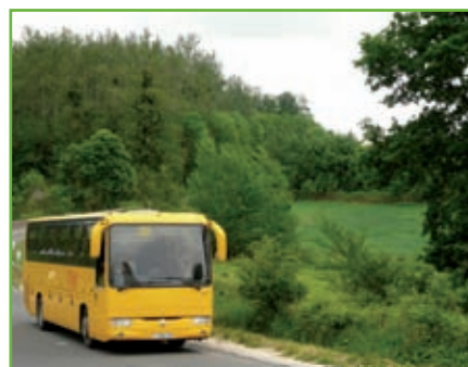
Transport : 2 €