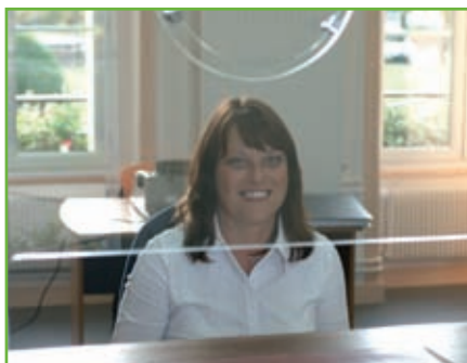
Services généraux : 21 €