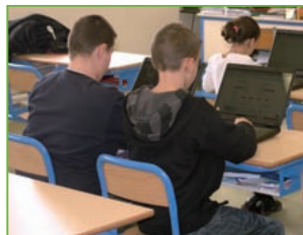
Scolaire Enseignement : 10 €