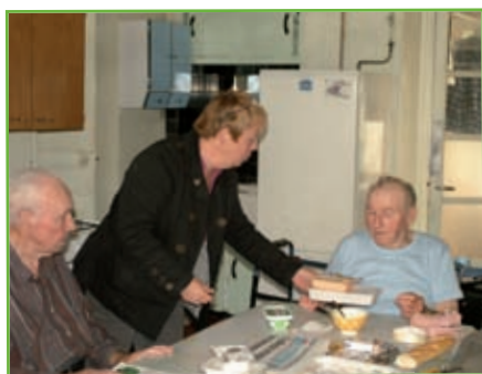
Action sociale et services aux familles : 22 €