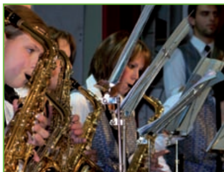
Sport – Loisirs / culture : 6 €