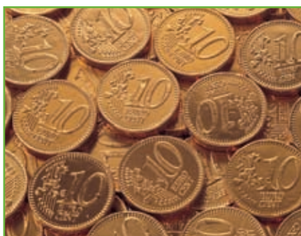
Amortissements des immobilisations 4 €