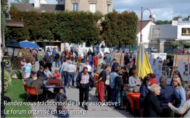
Rendez-vous traditionnel de la vie associative : Le forum organisé en septembre