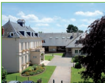
Patrimoine : 8 €