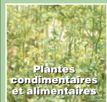
Plantes condimentaires et alimentaires