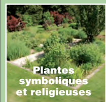
Plantes symboliques et religieuses