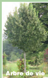
Arbre de vie