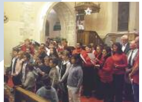
La Chorale dans l'Eglise Saint Jean-Baptiste