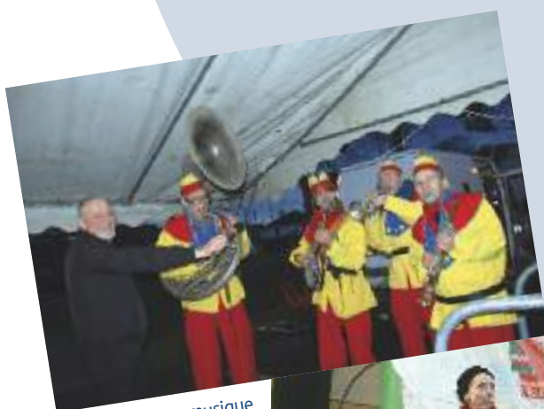
Gretz fête Noël en musique avec le Christmas band