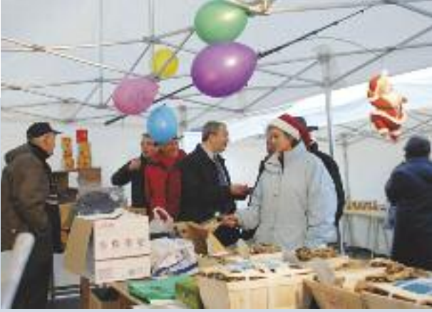
Le marché de Noël, moment de convivialité : ici vente d'huitres

nombre de Gretzois intéressés. Les petits comme les grands ont pu profiter d'activités : trampoline, manège, sculpteur de ballon... mais aussi manger des crêpes, de la tartiflette, cuisinés par les parents d'élèves. Les bénéfices de cette journée seront versés dans les coopératives des écoles.