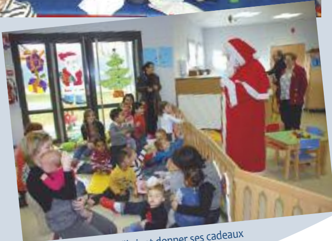
A la crèche, le Père Noël vient donner ses cadeaux