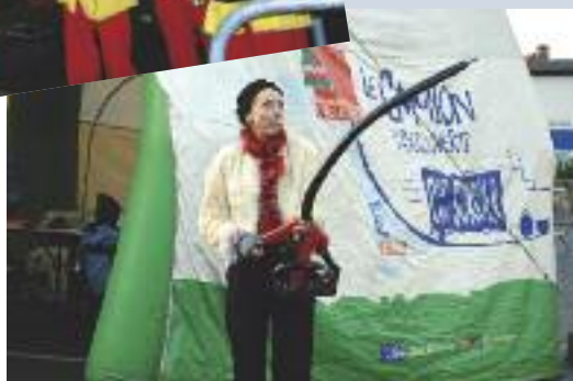
Sculpter des ballons : tout un art