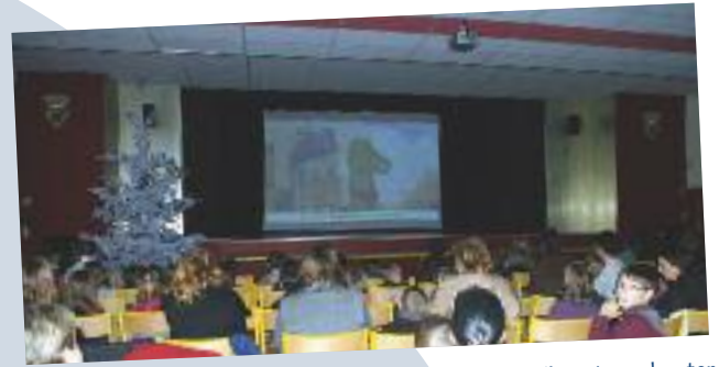
Spectacle musical sur écran géant pour les enfants : ils ont pu chanter tout en regardant un dessin animé, dont la vedette était un dinosaure, qui les a promenés dans les rues de Paris

Et si toutefois vous étiez passés à côté de toutes ces animations, ou si vous souhaitez revivre ces moments magiques, voici un diaporama de ces fêtes de fin d'année pour le plus grand plaisir de tous.