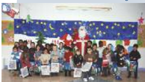
Les enfants de l'école maternelle Leclerc