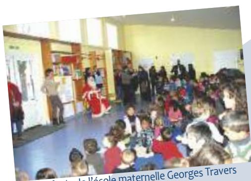
Les enfants de l'école maternelle Georges Travers