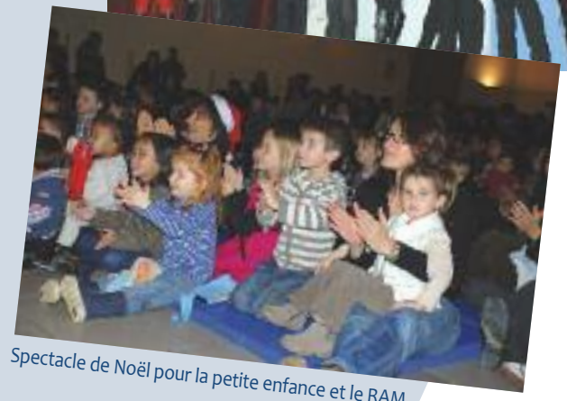
Spectacle de Noël pour la petite enfance et le RAM