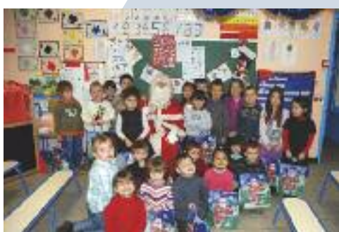
Les enfants de l'école maternelle Victor Hugo