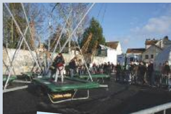
Animations pour Gretz fête Noël

Autre moment fort, « Gretz fête Noël » avec le passage du camion de « C'est pas sorcier », qui après avoir accueilli durant deux jours les enfants des écoles, attirera bon